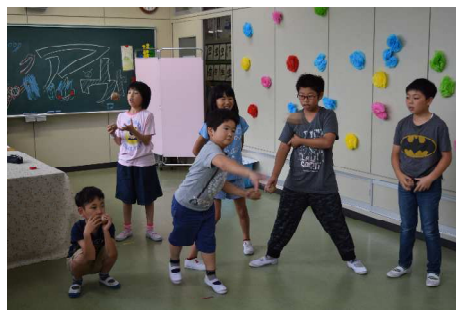
<ストラックアウト>