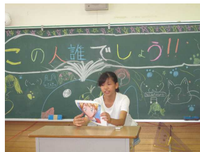
<この人誰でしょう?>