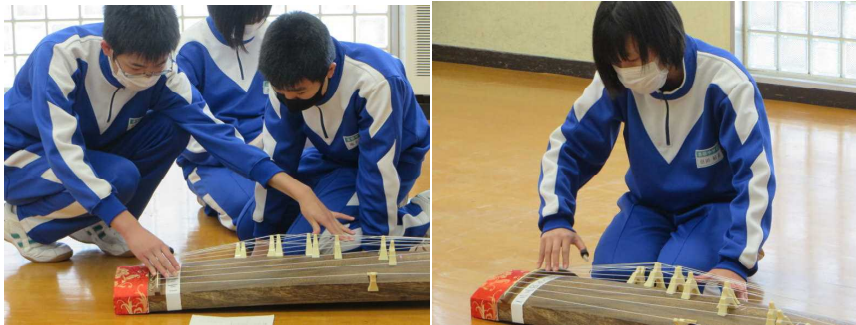
＜箏の演奏を楽しみました(1年生)＞

の中にはみるみる演奏が上達する子もおり、無限の可能性を感じました。校内に和の調べが流れる心和む一時でした。