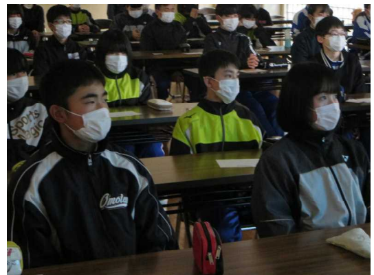
＜自分自身を大切にしよう(2年生)＞

短時間の練習でしたが、友達と協力しながら努力する姿を見ることができました。子供たち