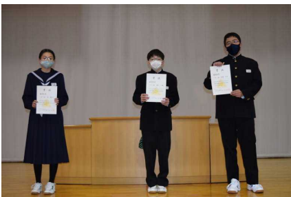
〈校内計算コンクールの表彰〉 〈話に耳を傾ける子供たち〉 →

「3学期の抱負」を、各学年の代表者の皆さんが始業式において発表しました。堂々とした発表態度に「目標を達成しようとする」強い意志が感じられました。また、集中して発表を聞く子供たちの姿勢に2学期までの成長が感じられるとともに3学期の更なる成長に期待が膨らみました。保護者の皆様、引き続き応援よろしくをお願いいたします。