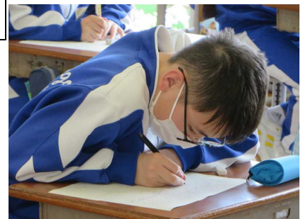
↑ ← <プレテストの様子>