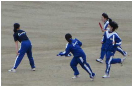
<リレー(バトンパス)>