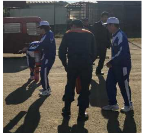
〈消火器を使った消火訓練〉

第2回避難訓練を11月20日(水)に実施しました。この訓練は、「①非常時における生命の安全確保を第一とするため、全員が迅速かつ安全に避難できるように、日頃より、避難経路・避難場所・人員点呼などの避難方法等を訓練し習得する。②防犯や防災に対する知識を深め、防犯意識、防災意識の高揚を図る。」ことを目的として行ったものです。地震により校舎設備に被害が発生し、二次災害も予想される状況を想定し、全員で校庭に安全に避難するものでした。子ども達は、今後の生活に生かすため真剣に訓練に臨んでおり、その真面目な姿勢には署員の方々も感心するほどでした。今後も、何事にも積極的に取り組む態度を育てていきたいと思っております。ご家庭でも励ましのことばをお願いします。