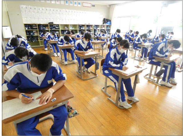
最後の漢字コンクールに挑む3年生

このコンクールは、2学期に実施する数学の計算コンクール、3学期に行う英語のスピーキングコンテストと合わせて、生徒に基礎的基本的な事項をしっかりと覚えさせる目的で実施しています。今回、合格できた生徒もできなかった生徒も、しっかりと反省して次につなげることが大切です。この頑張ろうとする意欲を、毎日の授業につなげてほしいと考えております。