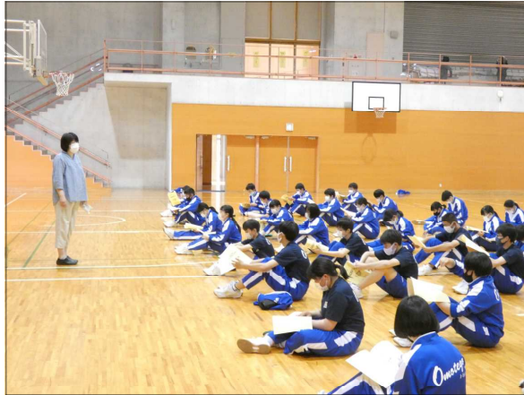
真剣に話を聞く生徒たち

5月25日(火)の総合的な学習の時間で、3学年は福祉体験を実施しました。介護される側の体験をすることで、どのように感じているのかとか何をしてもらいたいのかを知ることができ、介護する側の考え方も変わってきます。アイマスクをして介護してもらったり車椅子で介護してもらったりして、介護するためには、どんなことが必要なのかを学びました。今後の生活に活かしてほしいと思います。