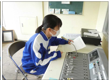
放送による進行、校長あいさつ、説明等