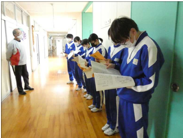
説明者は放送室前で待機