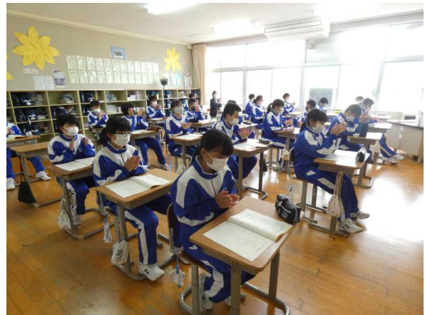
初めての生徒会総会（1年生）