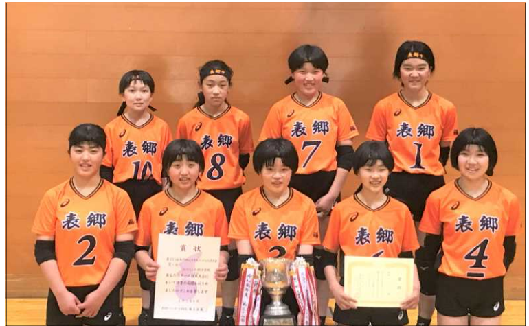
優勝したバレー部の皆さん