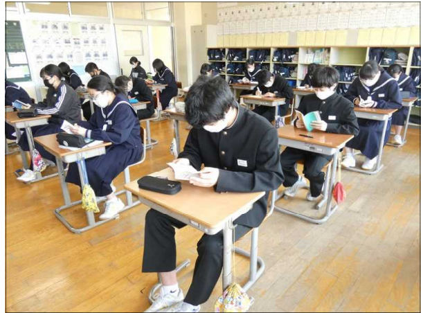
真剣に読書をする3年生

生徒が登校した後の8時5分から10分間、朝の読書タイムとなっております。廊下を歩いていると、各教室に人気(ひとけ)を感じないくらい静かな状況で実施されています。生徒は、自分の読みたい本を持参または図書館から借りて読んでいます。この時間は、静かに心を落ち着けて一日をスタートさせる意味でも有意義な時間となっております。