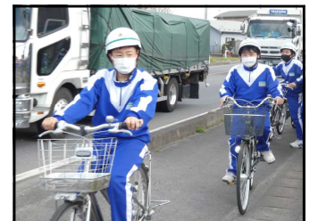
国道沿いを走行中→