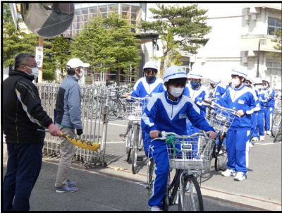
校門から出る生徒