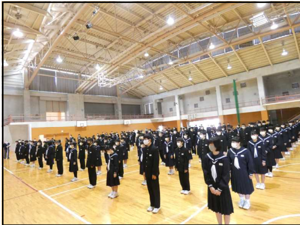
立派な態度で朝会に臨む生徒の皆さん

朝会后、「SOSの出し方に関する話」がありました。年度初めは、何かとめまぐるしく行事や授業が行われますので、悩みや嫌な事があっても友達や先生に相談せずに自分の中に閉じ込めてしまうことがあります。悩み等があった場合は遠慮せずに相談することや悩みを抱えてそうな生徒がいたら声をかけることなどを伝えました。