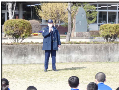
警察署の署員の方の講話