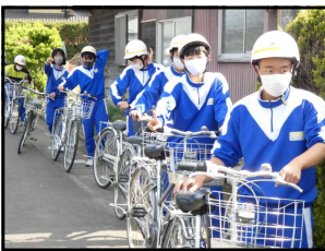
←国道289号線 での信号待ち