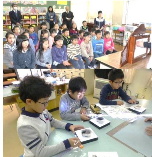
<4年生 放射線を観察する霧箱実験>

あの大震災から5年以上の月日が経ちました。小学1年生の子どもは、そのとき1歳でした。2年生は2歳でした。3年生に聞いてみたら「地震のことは覚えていません」という子もいました。少しずつ放射線量は下がってきました。しかし、地震を知らない子どもたちにとってこそ、放射線に対する正しい知識や、放射線から身を守る方法について、しっかり伝えていかなければならないと考えています。