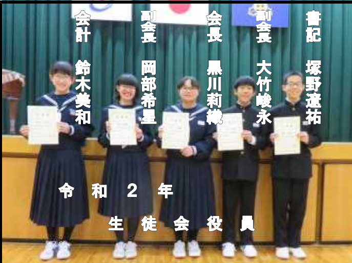
令和2年 生徒会役員