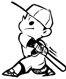
(白河グリーンスタジアム)

9月25日(火)から行われる東西しらかわ中学校新人総合体育大会の組み合わせが決まりました。3年生の引退後、2年生・1年生による新チームとして練習してきた成果を試し、また今秋の各大会や来夏の中体連大会本番に向けての絶好の力試しです。人数的に苦しい部も増え、他の部の力を借りたり、連合チームを組んだりする状況もあります。そうした中でもベストを尽くしましょう!