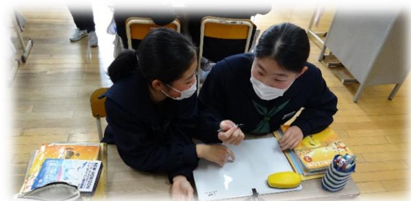
Rakugo in English(2の1)