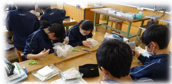
植物を育てる技術を身につけよう(2の2)