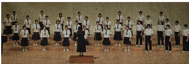
【9月6日(土)の福島民友新聞 朝刊に写真掲載】

東西しらかわ地区の代表として参加した本校特設合唱部は、課題曲『空』、自由曲『混成三部合唱とピアノのための組曲 クレーの絵本 第一集より あやつり人形劇場 幻想喜歌劇「船乗り」から格闘の場面』を熱唱し、美しいハーモニーを響かせ、銀賞を受賞しました。