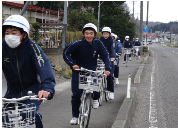
↑ 一列で車道側、さすが三年生!