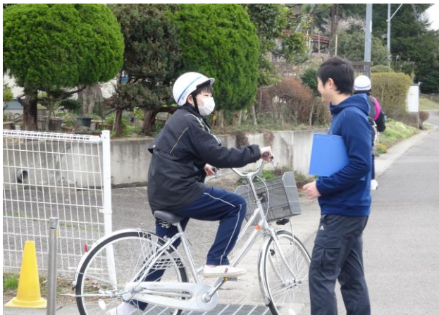
↑「気をつけて行ってらっしゃい!」

「大きな事故に巻き込まれたが、ヘルメットをきちんと着用していたため、命が助かった生徒がいた」という校長先生のお話のとおり、自分の身は自分で守れるよう、しっかりとヘルメットをかぶり、安全な運転に努めることが大切です。「自分は大丈夫」なんてことはありません。どんなに注意していても事故は向こうからやってくる場合もあります。今回の教室で学んだことを十分に生かして、登下校だけでなく、日常生活の安全にも役立ててほしいものです。