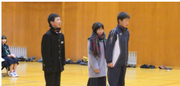
↑ 服装の決まりを具体的に紹介します

1年生は、これから部活動結団式まで、部活動見学を行います。3年間続けられる部活動を選択し、大いに熱中してほしいものです。2、3年生のみなさん、歓迎会の準備、運営、片付けまで、大変お疲れ様でした。