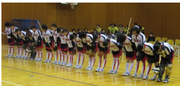
↑ 元気のいいあいさつ。さすが先輩！