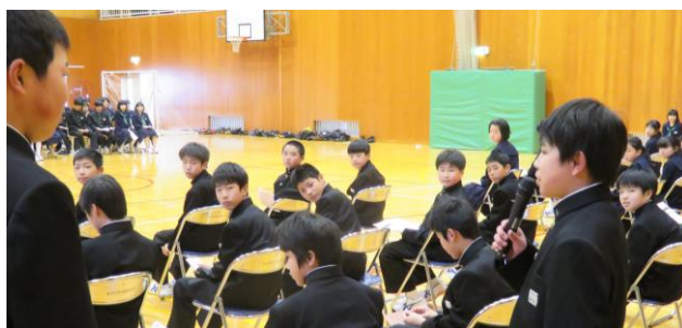
↑ 1年生へのインタビューの様子