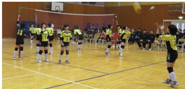
↑ 新入生の目の前でプレーします。