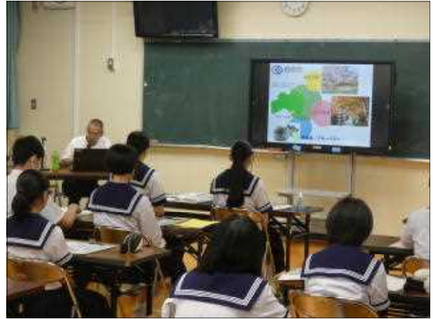
高校の校長先生が説明