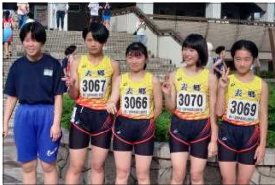
女子低学年4×100mリレーメンバー

この大会は、県南大会を勝ち抜いた者しか出場権が与えられません。高いレベルの中で自分の力を試すことができたこの経験は、今後の競技やその他の活動、そして今後の生活に大きな成果をもたらすと思います。頑張った選手の皆さんに大きな拍手を！