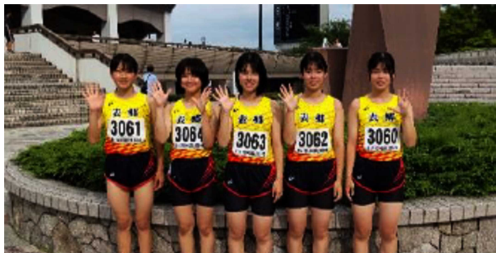
女子共通四種と共通4×100mリレーのメンバー