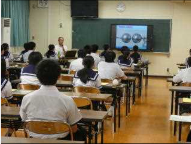
高校側の説明を真剣に聴く3年生