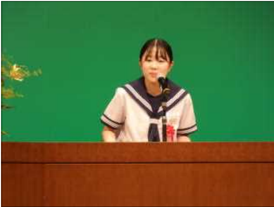
すばらしい発表でした