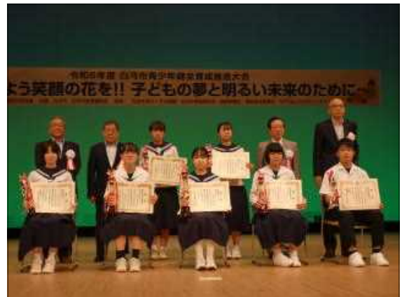
発表者全員で記念写真