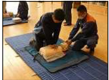
心臓マッサージの実技演習