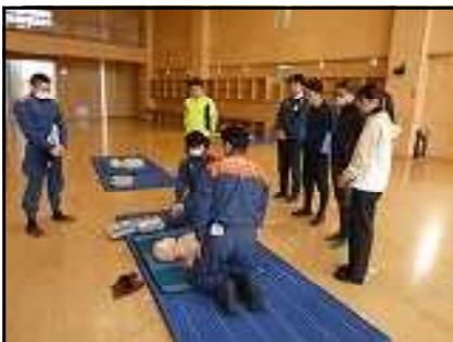
消防署員の模範実演を見る

年度スタートにあたり、先生方の心肺蘇生法講習会を行いました。大事な生徒の命を守るための講習会です。白河消防署表郷分署の署員3名を講師としてお招きし、AEDを使った講習を含め、さまざまな蘇生法の講習を行いました。生徒の命の大切さを第一に考えている本校の先生方は、真剣に講習に取り組んでいました。教育目標の3つ目に「命を尊び～」とあり、生徒にも命の大切さをしっかり教えていきます。