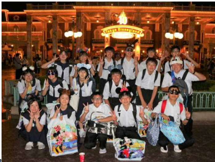
( ディズニーを満喫して、最高の笑顔の17名 )