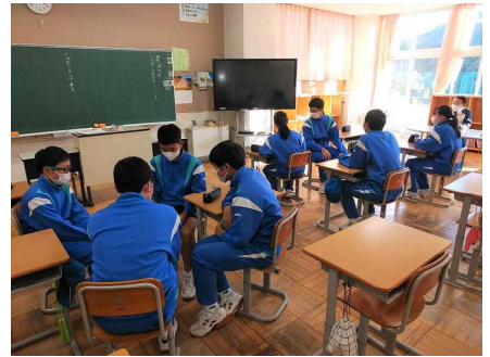
( 規律環境部 )