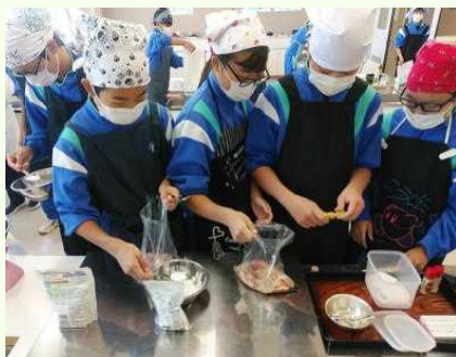
( 調味料の計量をしています )

19日(水)、2年生の家庭科の授業で、調理実習を行いました。今回挑戦したメニューは「鶏の唐揚げ」です。今年に入ってすでに3回目の実習ですが、揚げ物はほとんどの生徒が初心者。かなり戸惑っている様子でしたが、なんとか無事完成しました。休日などにお子様「唐揚げ作って～」と、リクエストしてみてもいいでしょうか？