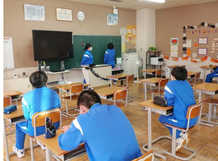
( 広報文化部 )