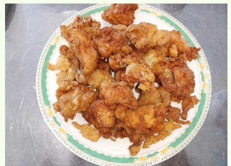
( でき上がりました! )