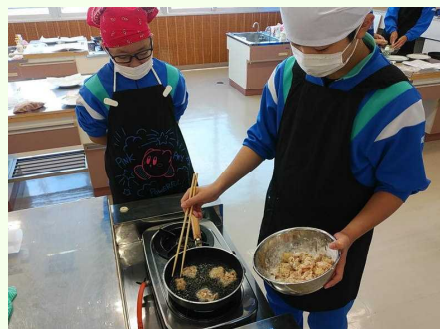
( 油が少ないので焦げないように )