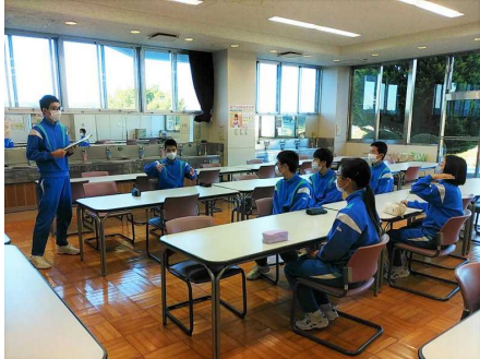
( 保健給食部 )

20日(木)、奉仕部会が行われ前期の活動について反省を行いました。令和4年度も前期が終了し、折り返しの時期となりました。後期の活動がさらに充実するように、真剣に話し合っていました。