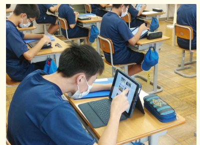
( タブレットを使っでの投票 )