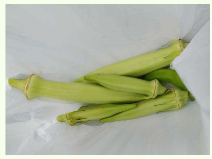
( 見事なオクラ、美味しそうです。 )