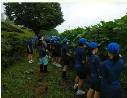
( 自分の背丈より大きい！ )

2年生の技術科の授業では、栽培学習としてオクラとサツマイモ、ジャガイモを育てています。昨日オクラの収穫を行いました。ひまわりの苗床を作る際に、畑にも堆肥を入れていただいたおかげで大きく育っていました。採れた野菜は家庭科の調理実習で調理・試食します。自分たちで作った野菜の味は格別でしょうね。楽しみです。