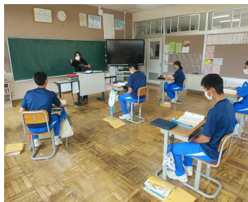
< 3年生 国語の授業 >

今週から各教科の授業が本格的にスタートしました。教科による得意・不得意はあるものの、子どもたちの表情からは「今年がんばるぞ!」という意気込みを感じることができました。新型コロナウイルス感染症が広がったこの2年間は、その影響で臨時休校等の措置がとられ、学校生活そのものがストップしたこともありました。そのことを考えると、「授業ができる」ということ自体が幸せなことであると感じます。そのことを忘れずに、毎時間の授業にしっかりと取り組めるよう、子どもたちとともに頑張ってもらいます。