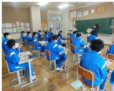
< 2年生 家庭科の授業 >