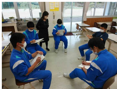
< 3年生 美術科の授業 >