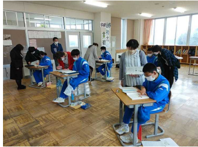
3年生：国語の授業(上) 2年生：英語の授業(下)