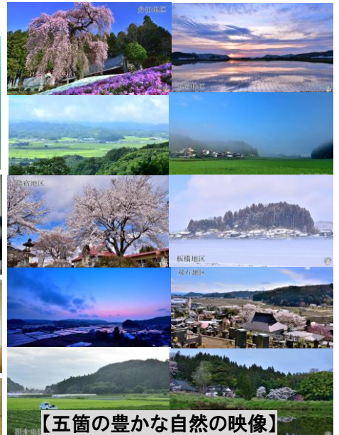
【五箇の豊かな自然の映像】