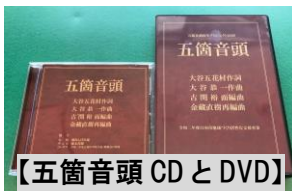
【五箇音頭 CD と DVD】