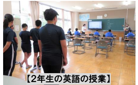
【2年生の英語の授業】

見学した授業は1年生の体育の授業と2年生の英語の授業です。1年生は、ついこの間まで一緒に活動していた6年生と対面し、ニコニコと笑顔で準備運動の「縄跳びパフォーマンス」を行っていました。2年生の英語の授業では「Repeat after ミーガン先生！」に合わせて6年生も英単語の発音に参加してもらいました。13人の6年生に参観されていた2年生ですが、中学生としてのSpeakingの見本を見せていました。今年度も、幼小中の連携をしっかりと深めて、地域で子どもたちの健やかな成長を促していきたいと思ひます。