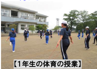
【1年生の体育の授業】

5月7日に、五箇小学校の6年生が中学校の授業を見学に来ました。これは、小中学校連携事業の一環として、中学校に入学する時のギャップを和らげるとともに、中学校での授業や活動に興味を持たせ意識を高めさせることを目的としています。