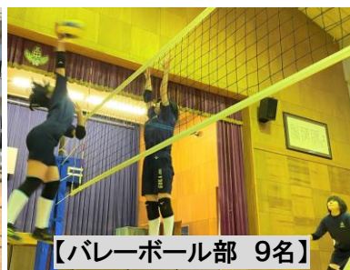
【バレーボール部 9名】