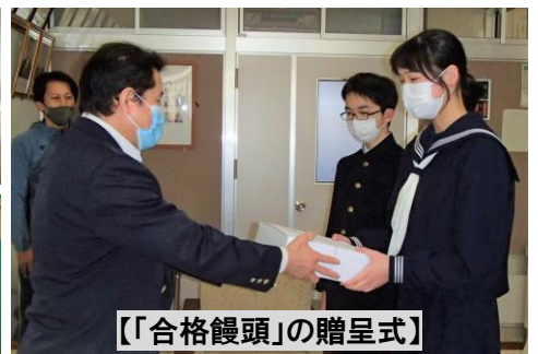
【「合格饅頭」の贈呈式】