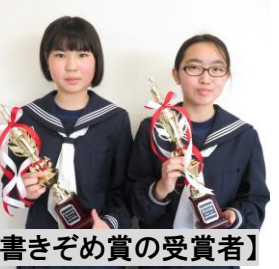
【書きぞめ賞の受賞者】