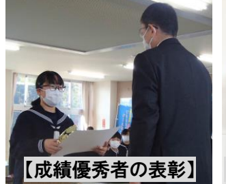
【成績優秀者の表彰】