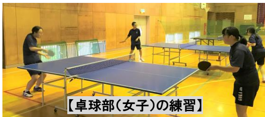
【卓球部(女子)の練習】