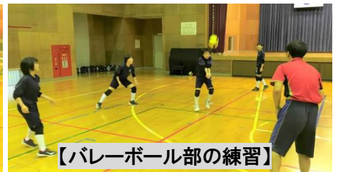
【バレーボール部の練習】

今回の大会は、新型コロナウイルス感染拡大防止の対応のために、すべての競技が無観客での実施になります。保護者の方々には観戦をご遠慮していただかなければなりませんので、ご理解とご協力をよろしくお願いいたします。なお、各競技の試合の結果については、中学校のホームページに随時掲載しますので、ご覧いただければと思います。