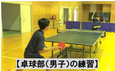
【卓球部(男子)の練習】

新しいチームでの力を試す大会となりますが、自分たちのもっている力を十分に発揮し、一つでも多く勝利してほしいと思います。たとえ、劣勢に立たされたとしても、自分の今までの練習を信じ、仲間を信じ、チームとして声を掛け合い、試合のよいリズムを取り戻してください。そして、もっているパフォーマンスを出し切れる試合になることを期待しています。また、中体連総合大会ができなかった3年生の思いを胸に、3年生の分まで五箇中学校の選手として奮起してほしいと思います。