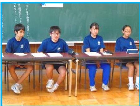
【結城祭に向けて。実行委員会の様子】

10月19日(土)に五箇中学校「結城祭」を開催いたします。今年度は、「少年の主張・英語弁論発表」「学年ステージ発表」「全校合唱」「芸術鑑賞(フルート・ピアノ演奏)」等を予定しています。保護者・地域の皆様のご来校をお待ちしております。