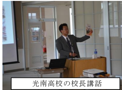
光南高校の校長講話

6月14日(火) 5・6校時2階多目的ホールにおいて全校生が参加して高等学校説明会が行われました。白河旭高校、光南高校、白河高校、白河実業高校、修明高校の各校長先生や先生方がおいでくださり、ご講話をしていただきました。さらに今年16日(木)私立高校の説明会を行い、3年生が参加しました。夢や希望を形にし努力することはとても大事なことです。生徒が瞳をきらきらさせて集中していました。