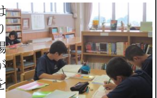
今週の放課後の図書館

大きな課題に立ち向かうために、小さなことを積み重ね、力を蓄えることが大切です。毎日の予習や自学ノートによる小さな力、週末課題で週ごとの力のまとめ、学期の力のまとめとしての期末テスト。テストは自分の力を試す場であり、自分の力を鍛え蓄える場でもあります。テストが続きます。生徒の努力を見守ってください。